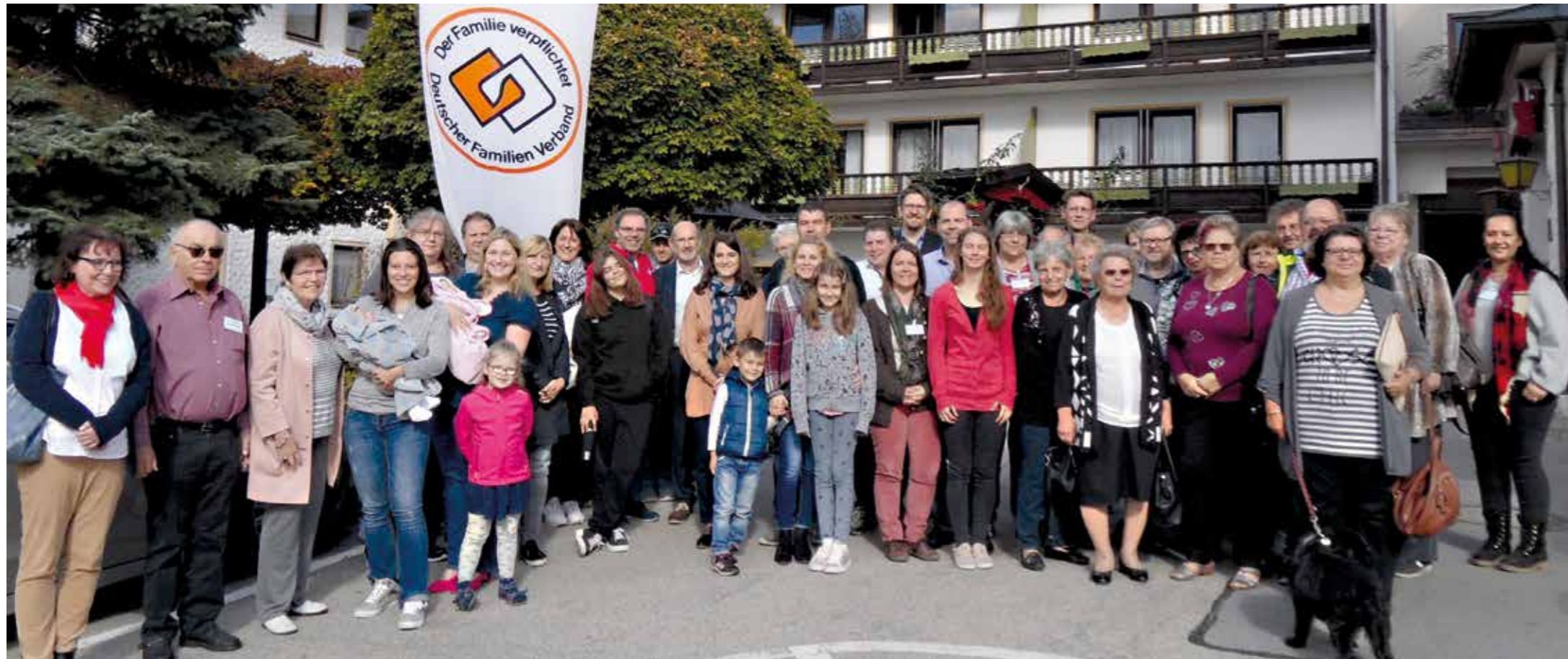
Alle Delegierten des Landesverbandstags