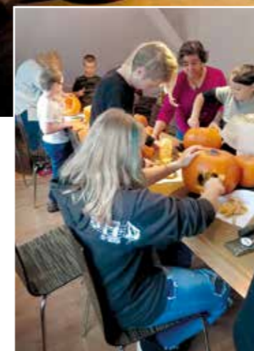
Saures oder Süßes? Völlig egal, denn die Kids hatten richtig Spaß beim Kürbis-Schnitzen