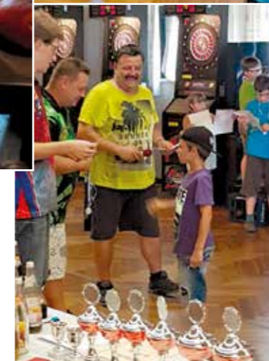
Der Dart-Sport erfordert Präzision und Konzentration. Auch hier waren die Peißenberger Kinder Feuer und Flamme. Hier: Impressionen vom Dart-Turnier und die Siegerehrung